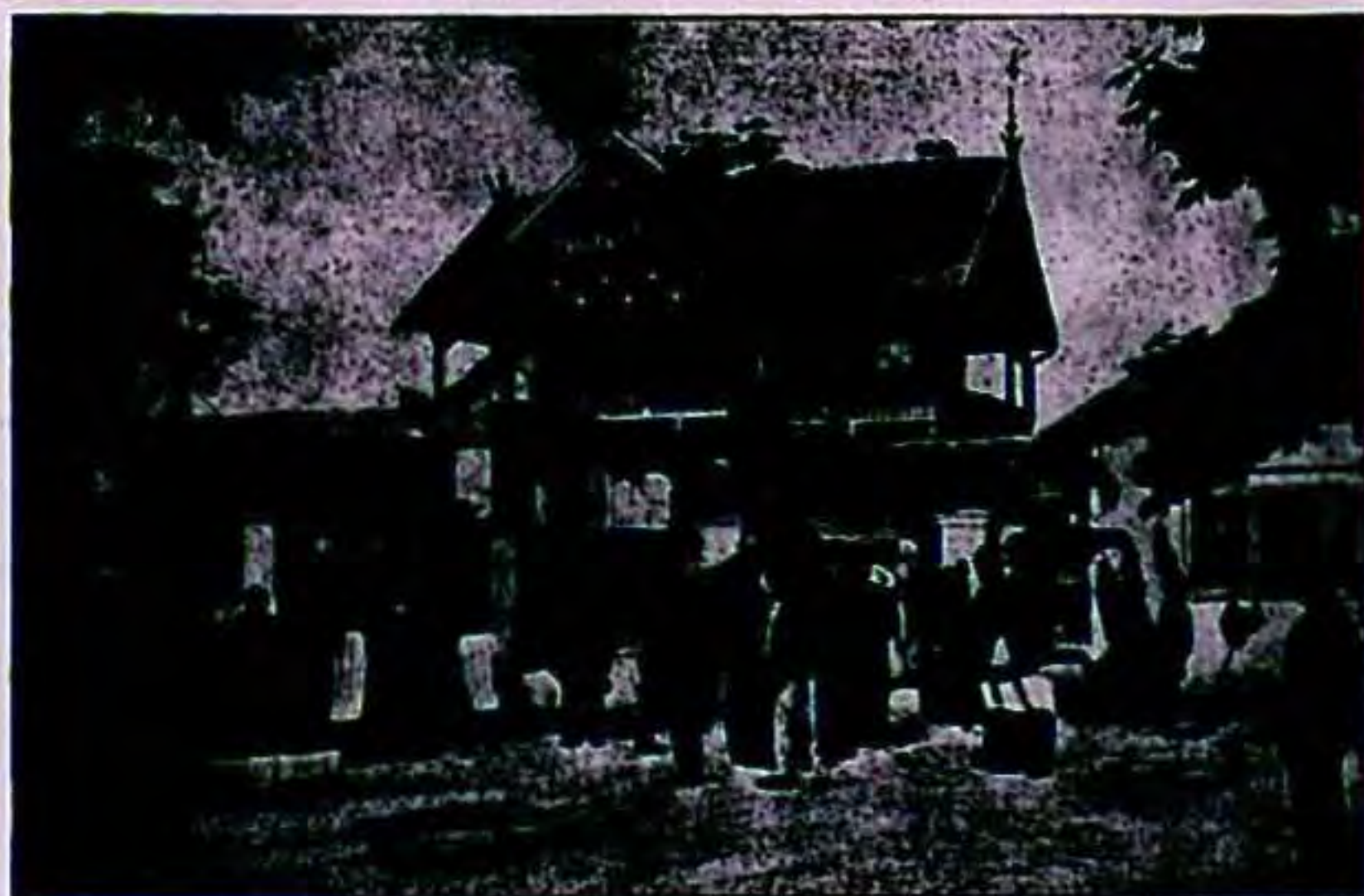
Gostionica „Kraljici Prirode“ E. Presečki-a.

Objed se može i posebice naručiti, da se naznači broj gostiju i vrsta jestiva, te da to domaći najave usmeno, a strani pismeno u Šmidhenovoj ulici broj 4.