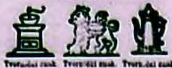
Tvornički znak. Tvornički znak. Tvornički znak.

Osobito Vas molimo, da dobro pazite na naše tvorničke znakove i potpis: