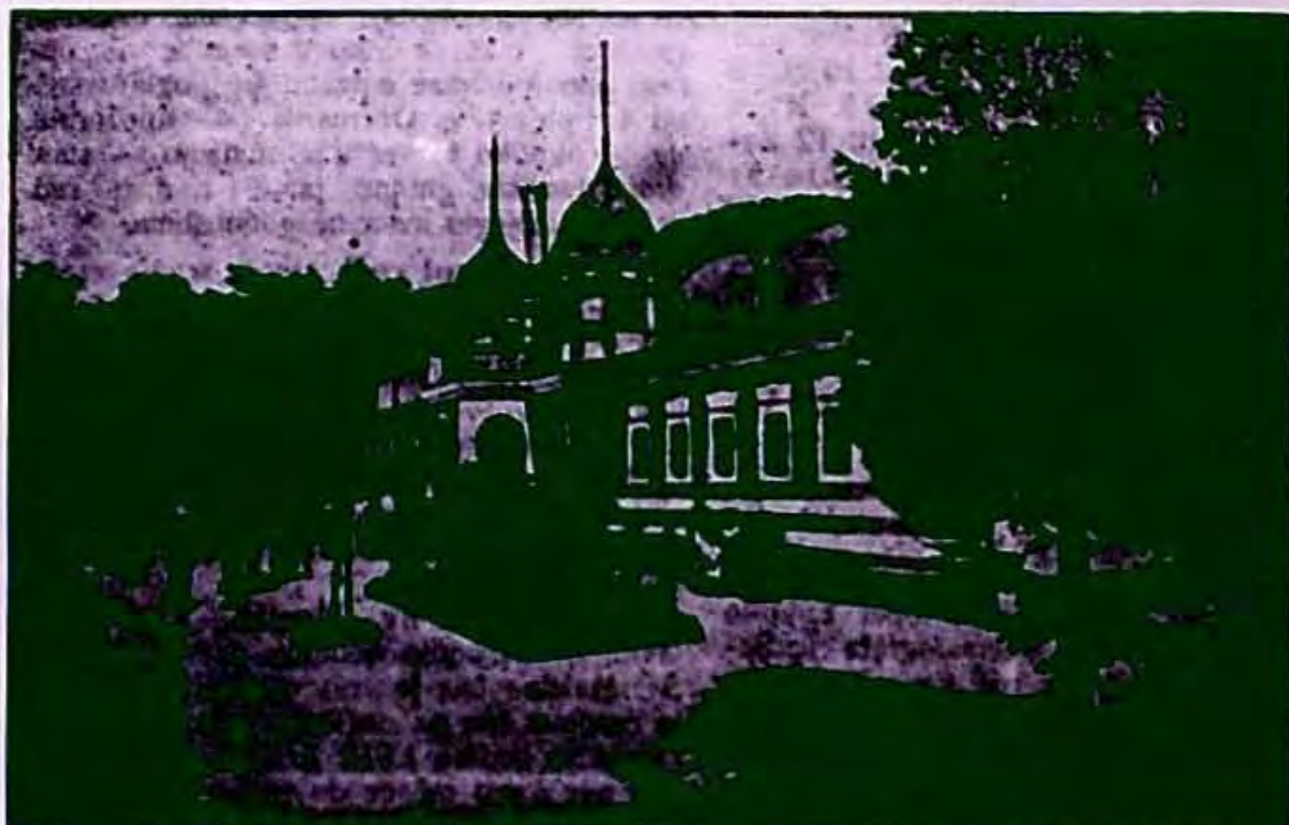
Lječilište u Samoboru.