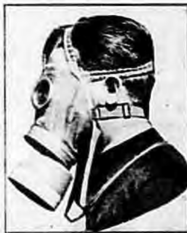
Civilna plinska maska štiti od bojnih otrova

U Savskoj banovini do danas je izgrađeno već nekoliko uzornih skloništa, koja će služiti u cilju općih narodnih interesa. Mnoga lica, naročito razni odredi i ekipe neće moći po svom pozivu da ostanu u skloništu. Ona će trebati da vrše pružanje prve pomoći, da prenose ozlijeđene, da utvrđuju otrove, da čiste zatrovan teren. Ti ljudi treba su snabdjeveni sretstvima lične zaštite. Uz sve moguće aparate (Dreger, Degea Audos, Fenzi) potrebite kod disanja s kisikom, uz zaštitno odijelo, prvenstveno treba spomenuti civilnu plinsku masku M. 33 (vidi sliku).