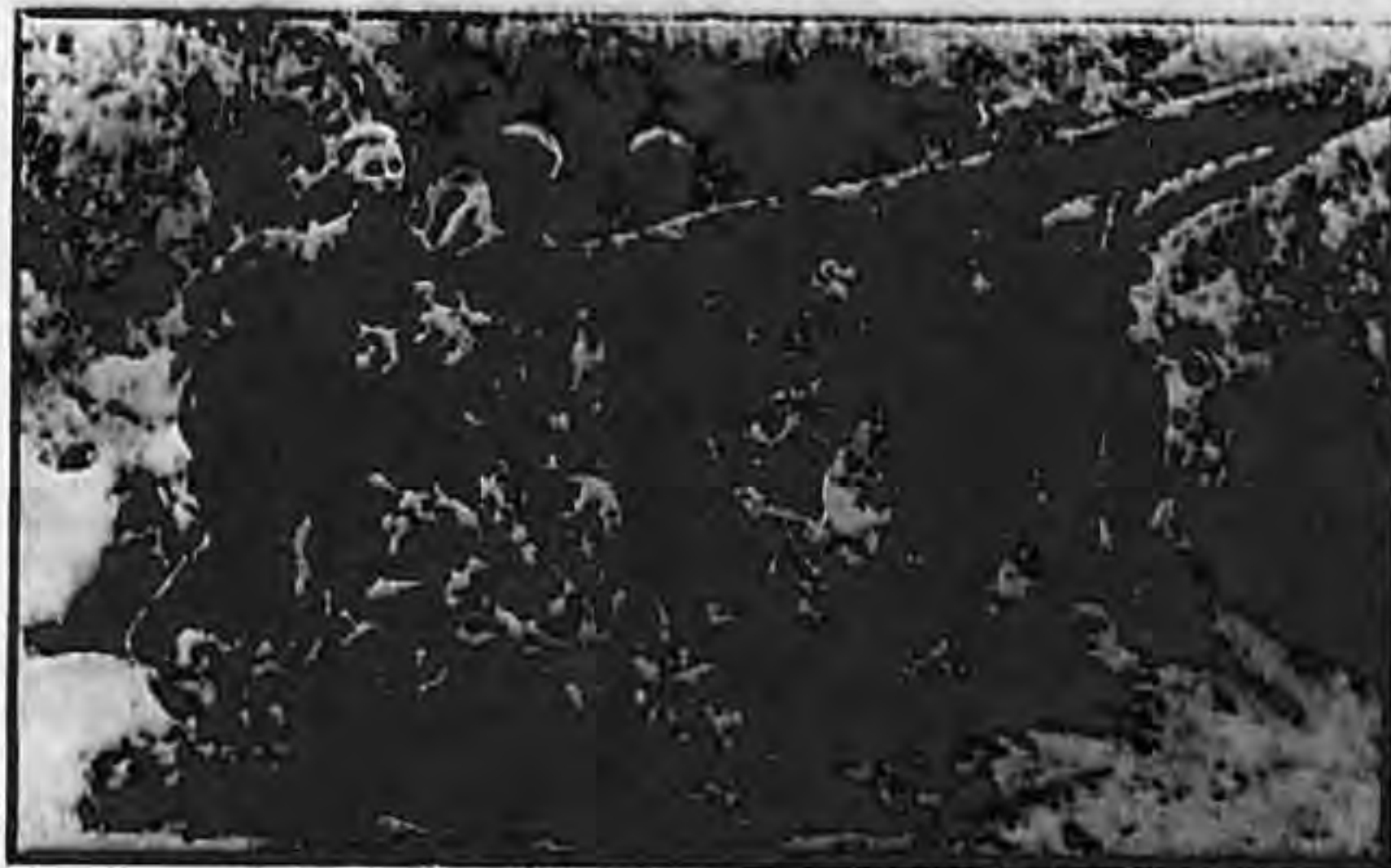
Ni to ne sprečava Njemačku vojsku u napredovanju Pioniri odatranjuju drveće, koje su Sovjeti kod povlačenja nabacali na jed- nu ogradu na Kavkazu.

Ustašom mogu postati samo takvi Hrvati, koji su duševno podpuno zdravi, koji se ničim nlesu ogriješili o pro-