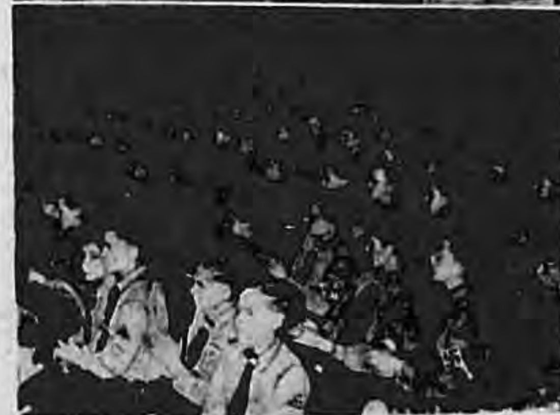
Hitlerova mladež i ratna mornarica: slika gore: paradna koraćnica njemaćke ratne mornarice. Slika dolje: Hitlerova mladež za vrijeme jednog predavanja o znaćenju i važnosti ratne mornarice u berlinskom »Sportpalastu«. (ES)