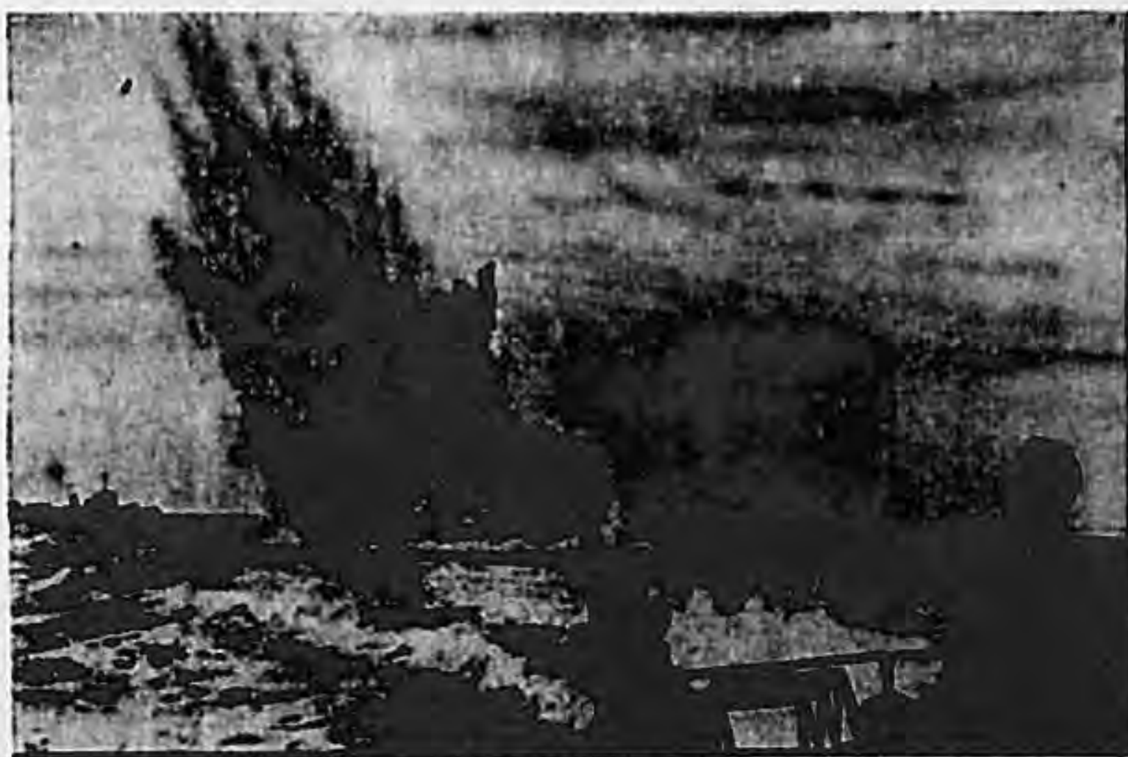
Njemački minolovci na Crnom moru uništili su baš jednu opasnu minu.