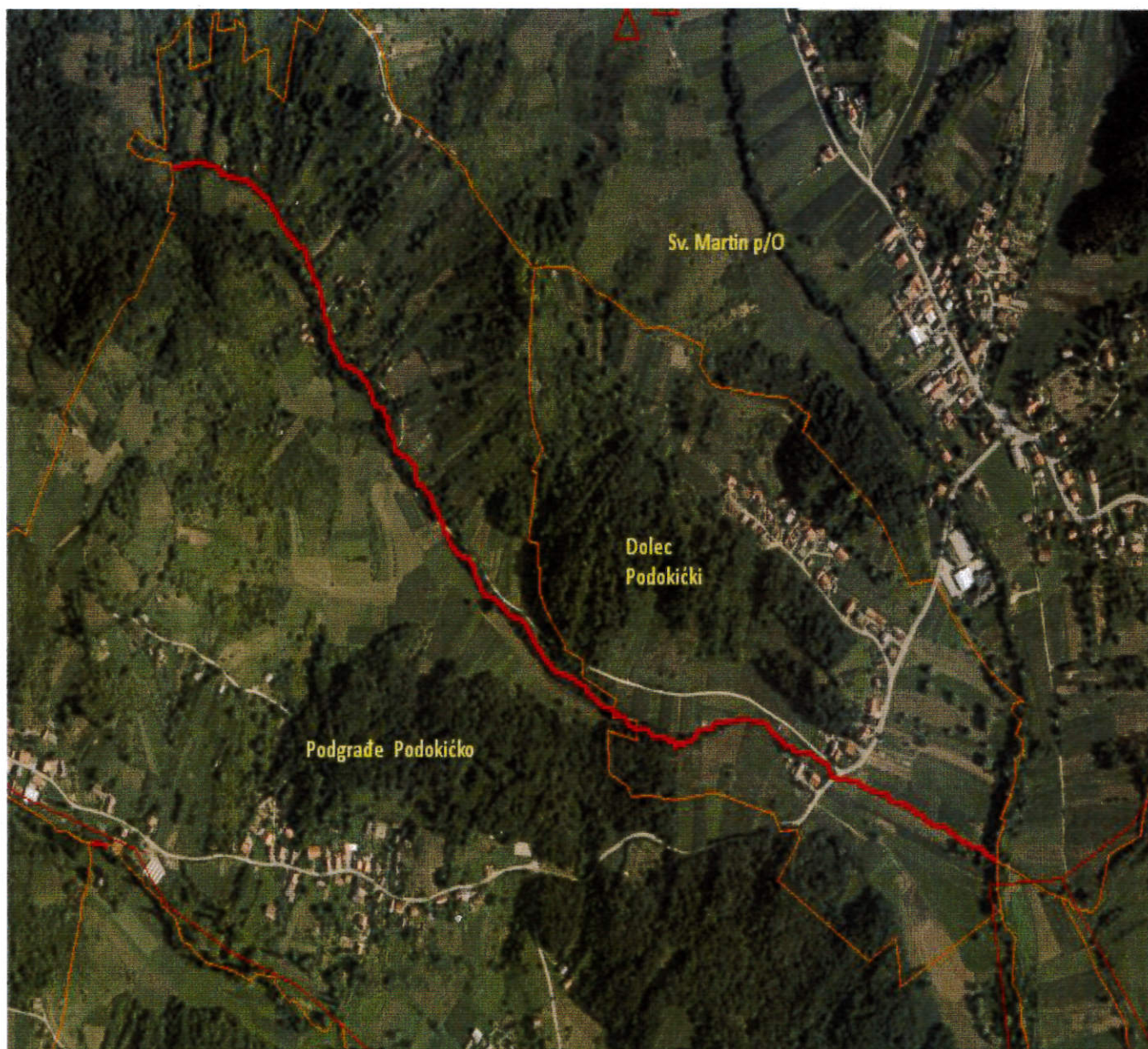
Arkod pregled sadašnjih granica naselja