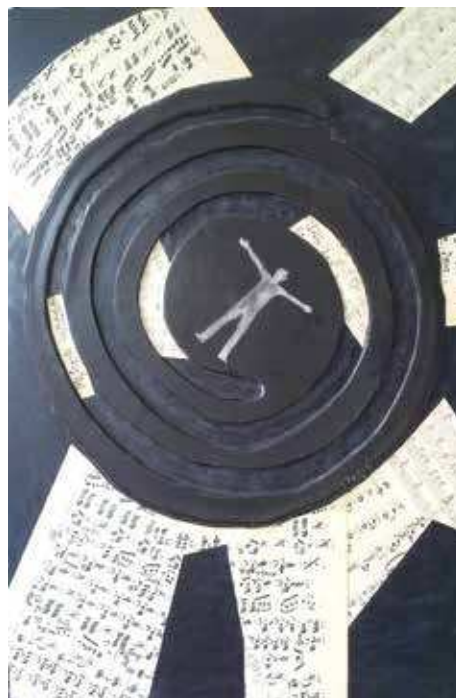
Virtualni ekvilibrij, 65 x 43 cm, vosak na drvu, kolaž

Djela Ivane Puljić pokušavaju ispričati upravo tu bezvremensku, univerzumsku, vibracijsku priču vizualnim elementima. Čini se da je umjetnica očarana činjenicom da notni zapisi na papiru, kao vizualni podražaj, nerazumljivi muzički neškolanom oku, u rukama se poznavatelja pretvaraju u nešto što nas može prebaciti u neslućene svjetove. Onaj koji poznaje note