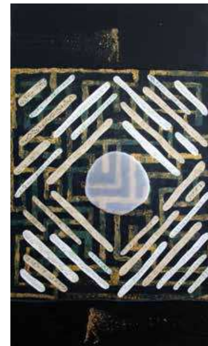
Labirint, 83 x 50 cm, vosak na drvu, kolaž

Riječi likovnoga govora kojim se autorica služi pomalo odudaraju od onoga na koji je publika navikla. Svoje priča Ivana ispisuje na platna rastegnuta na drvenu dasku. Ona postaju pozornice na kojima se gradi kolažna kompozicija od isječaka partitura te raznih elemenata i malih ljudskih figura izrađenih od voska. Monokromatski kontrast između uglavnom tamne pozadine i svijetlih isječaka partitura obogaćen je upravo tim malim, vibrantnim figurama živih