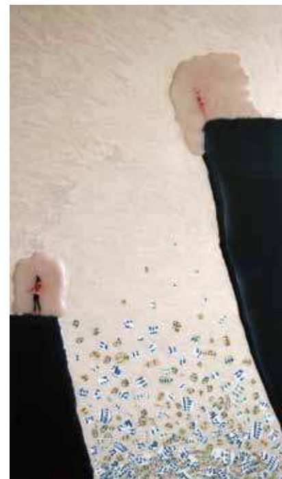
Neopipljivi zrak, 83 x 50 cm, vosak na drvu, kolaž

pomoću svog instrumenta pretvara ih u vibracije koje nas, ako smo s njima u suglasju, potiču na kretanje, odnosno ples. Svojim djelima umjetnica nam govori da je kretanje kao takvo osnovni univerzumski zakon, te je stoga ples, kao estetski najprihvatljivija ljudska kretnja, učestali motiv Ivaninih djela. Svojim malim, rasplasanim, levitirajućim ili muzicirajućim figurama poručuje nam koliko smo u univerzumskom prostranstvu maleni. No, bez obzira na našu fizički nerelavantnu veličinu u svemirskim razmjerima, u stanju smo proizvesti nešto što ima božanskoga u sebi, muziku.