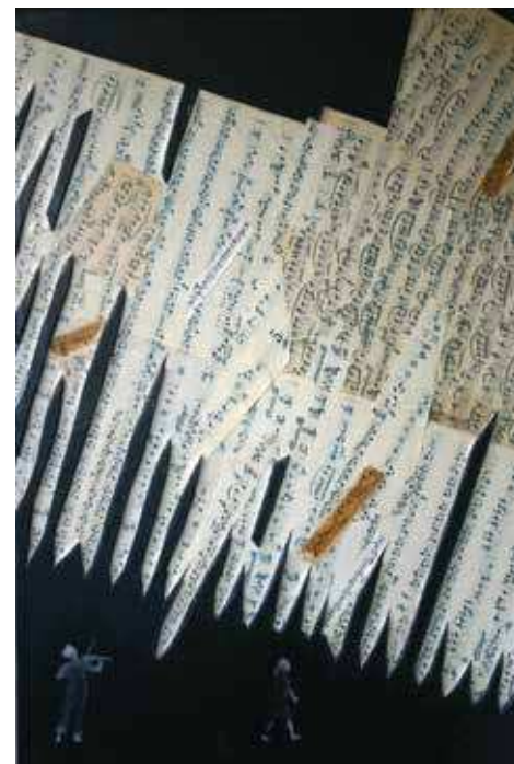
Zvuk tišine, 51 x 86 cm, vosak na drvu, kolaž

Zatvaram oči. Prepuštam se dubokoj, mističnoj i uravnoteženoj tišini. Moja je svijest usmjerena na zrak koji udišem. Ne vidim ništa, ne čujem ništa, osjećam samo bezvremenski mir. U to more mira i tišine, odjednom počinje prodirati tanašni nemir u obliku jedva čujnoga zvuka. Polagano i nježno uvlači se u tišinu bivajući jači. Zvuk postaje sve bliži i koherentniji. Naposlijetku me potpuno obavija. Dodiruje moje srce, pred još uvijek zatvorenim očima rasplamsava intenzivnu paletu žute, narančaste i crvene, od njega mi vibrira svaka stanica tijela. Ustajem i prepuštam se čarobnom ritmu koji me u potpunosti obuzima. Plešem zatvorenih očiju osjećajući se u potpunom suglasju i ekvilibriju sa svijetom oko mene. Ritam postaje sve jači, čini mi se da me uzdiže te da levitiram. Prkoseći gravitaciji uznosi me u univerzumska prostranstva. Osjećam potpunu radost življenja, na mom licu titra smiješak, a u srcu ljubav. U nepreglednom svemirskom prostranstvu znam da sam samo nevidljivo, gotovo neopipljivo zrnce pijeska, no u srcu se osjećam izabranom, neponovljivom i jedinstvenom. Moj