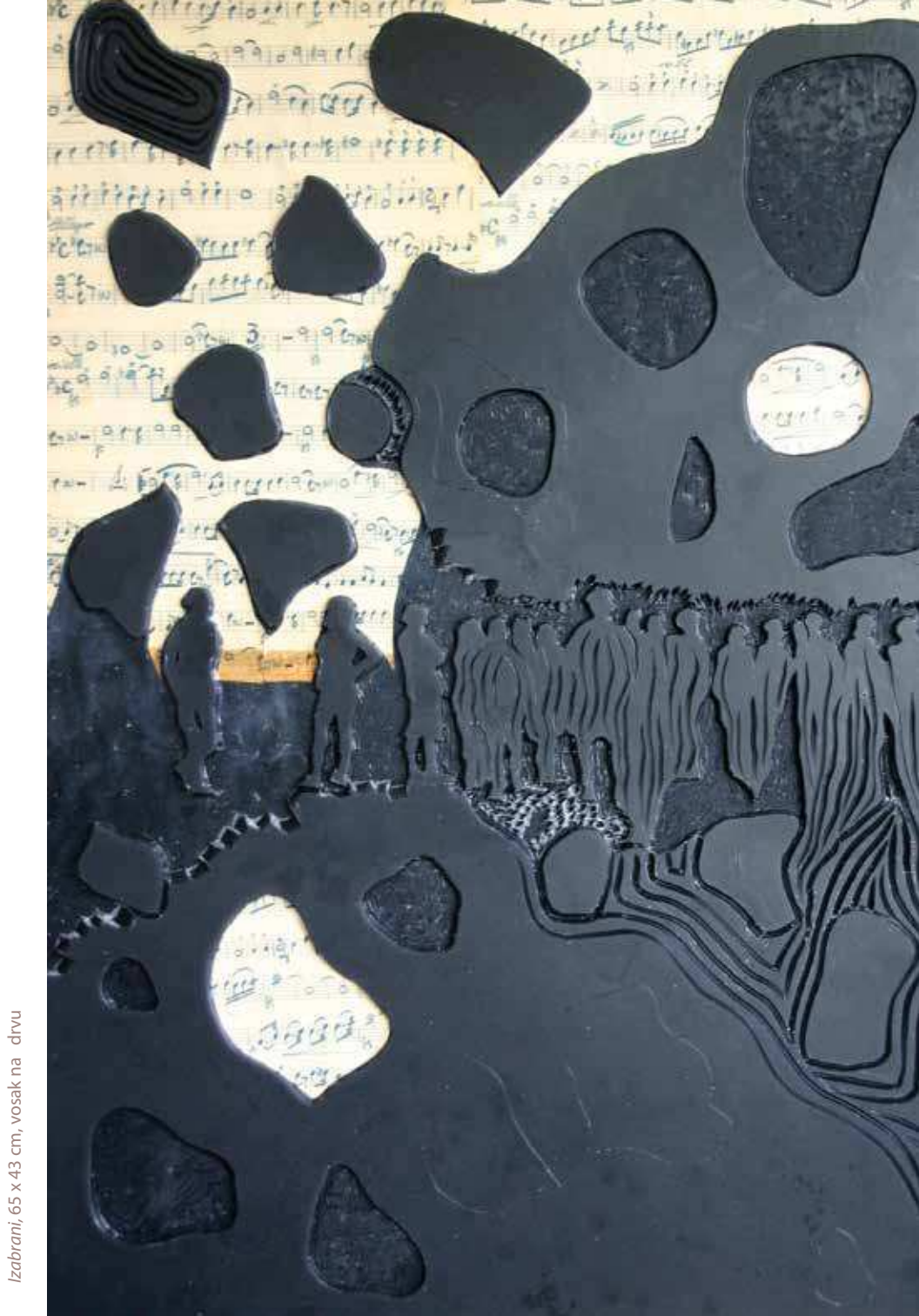
Izabrani, 65 x 43 cm, vosak na drvu